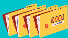
TABLE DE DIALOGUE SUR LA SANTÉ ET LA PROTECTION SOCIALE

RAPPORTEUR SUR LES DROITS DES FEMMES DE LA CIDH