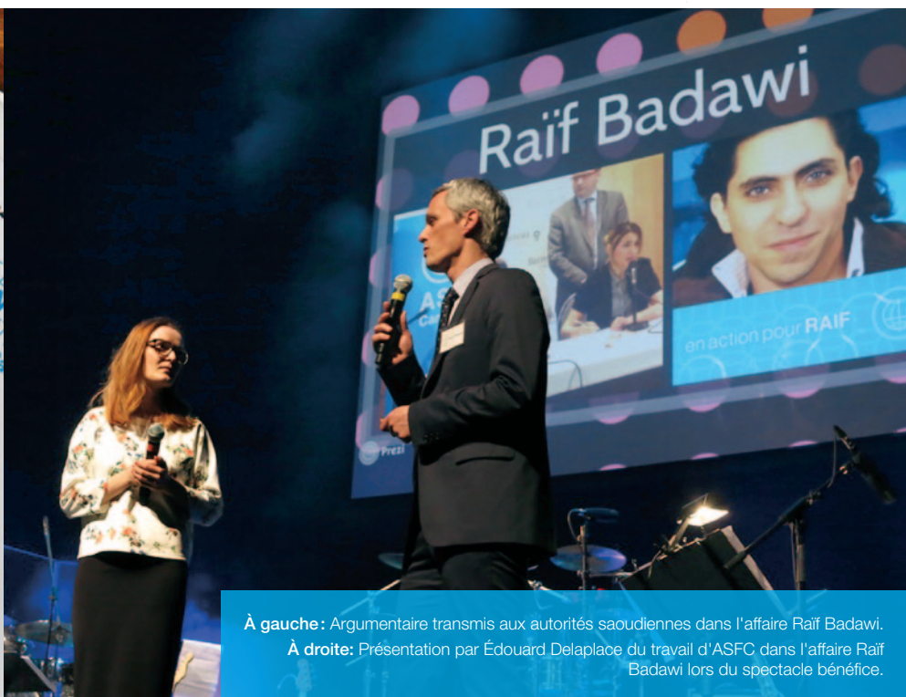
À gauche: Argumentaire transmis aux autorités saoudiennes dans l'affaire Raïf Badawi.