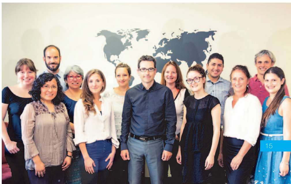
Équipe du siège d'ASFC à Québec.

Coordonnatrice administration et finances